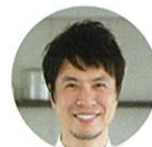
パネリスト コウケンテツ