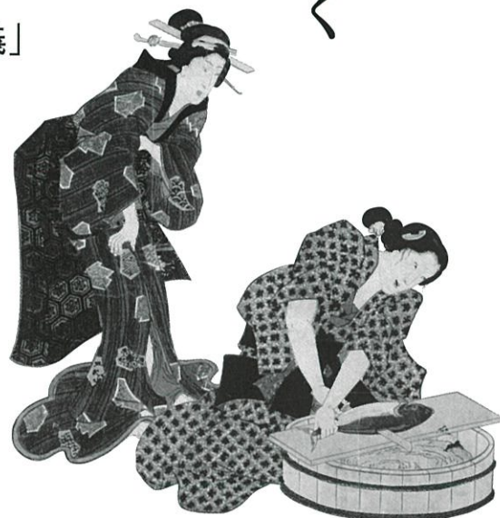
「十二月之内 卯月初時鳥」